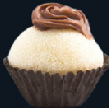
BRIGADEIRO NINHO COM NUTELLA